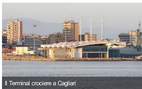
Il Terminal crociere a Cagliari

Il 20 e 21 febbraio prossimi, la città di Cagliari ospiterà la prima edizione della Borsa internazionale delle imprese italiane e arabe.